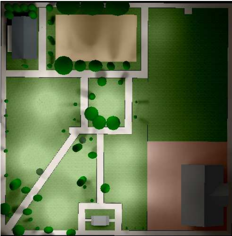
Simulação da iluminação da praça através do Software Dialux.